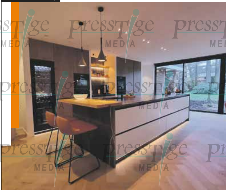
Vier generaties ervaring in uw interieur op maat

Ontwerp Woonstudio Jan de Weijer MAATMEUBEL.NL